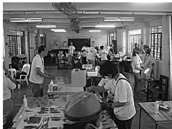
フィリピンマニラ市でのボランティアの様子